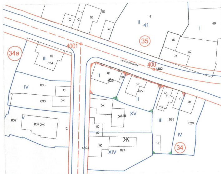
ПЛАН ЗА РЕГУЛАЦИЯ -ПРЕДЛОЖЕНИЕ ЗА ИЗМЕНЕНИЕ М 1:500

2. Регулационните линии на УПИ I-626, II- 627 и III-628 да се прокарат по имотни граници на съществуващи ПИ с идентификатори 65927.501.626, 65927.501.627 и 65927.501.628 по Кадастрална карта.